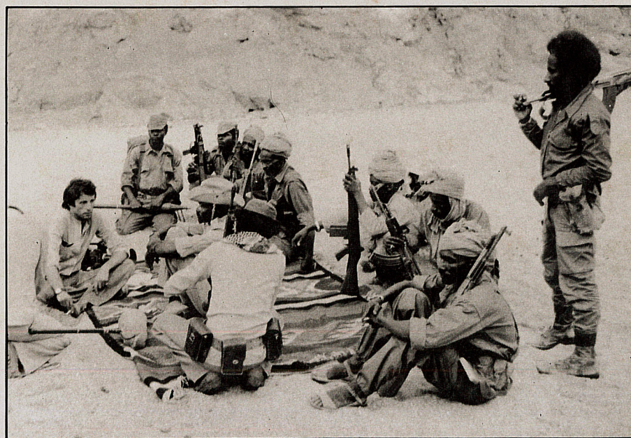
Couverture : Virginie Demachy