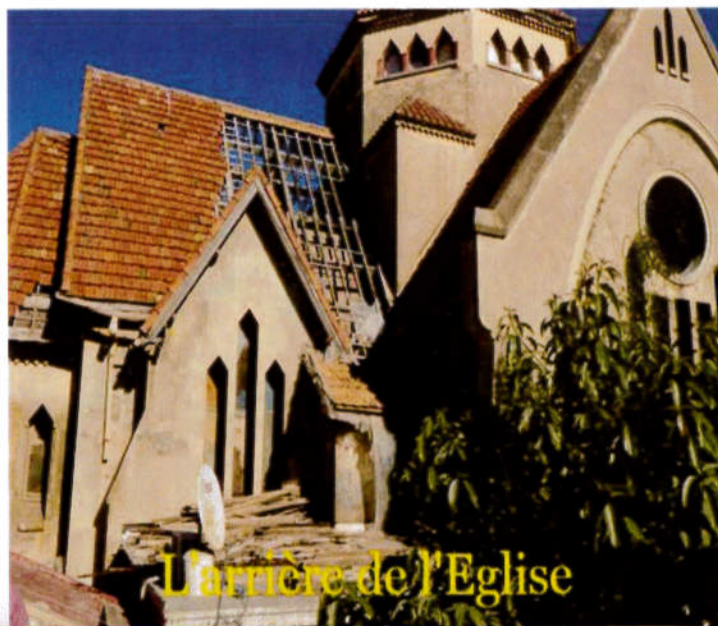
L'arrière de l'Eglise

Nous refaisons notre réunion à Pentecôte cette année 2024 mais cela se passera à Aix en Provence Maison Maréchal Juin. Edifice magnifique dédié à nous, pieds